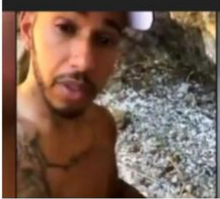
WAL strandet mit sechs Kilogramm Plastik im Bauch

14. November 2018 07:30 Ein Wal strandet mit sechs Kilogramm Plastik im Magen gestrandet. Das Tier hatte Hüll-, Getränke- und Plastikflaschen im Bauch.