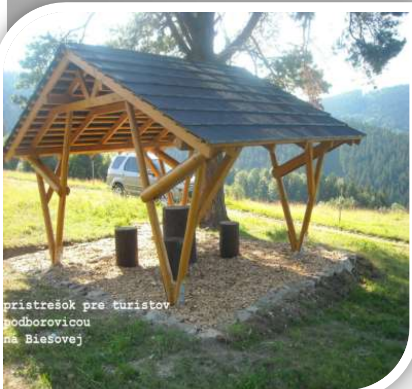
prístrešok pre turistov podborovicou na Biešovej