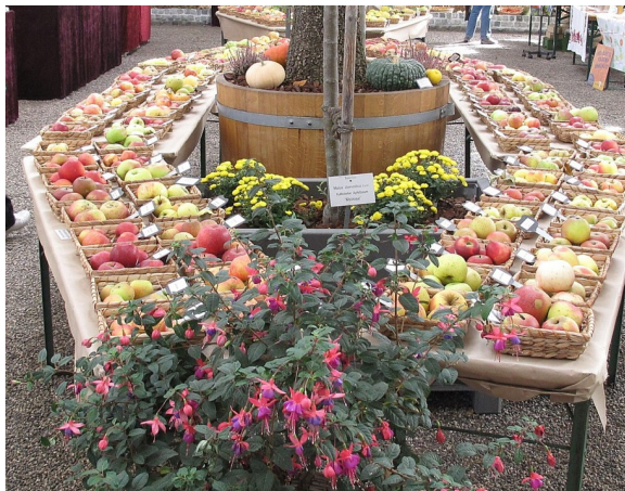
Apfelmarkt im Botanischen Garten in München

Seit 22 Jahren fördert das Staatsministerium für Ernährung, Landwirtschaft und Forsten die Streuobst-Akteure in Bayern mit der Kampagne, die federführend von der LfL ins Leben gerufen wurde. Neben den Landwirten als Erzeuger, Verarbeiter und Direktvermarkter beteiligen sich Gartenbauvereine, Verbände, Fachberater, Kommunen, Bildungseinrichtungen und Streuobstinitiativen, die sich mit viel Herzblut und Tatkraft für den Erhalt der Streuobstwiesen einsetzen und diese auch erfolgreich nutzen.