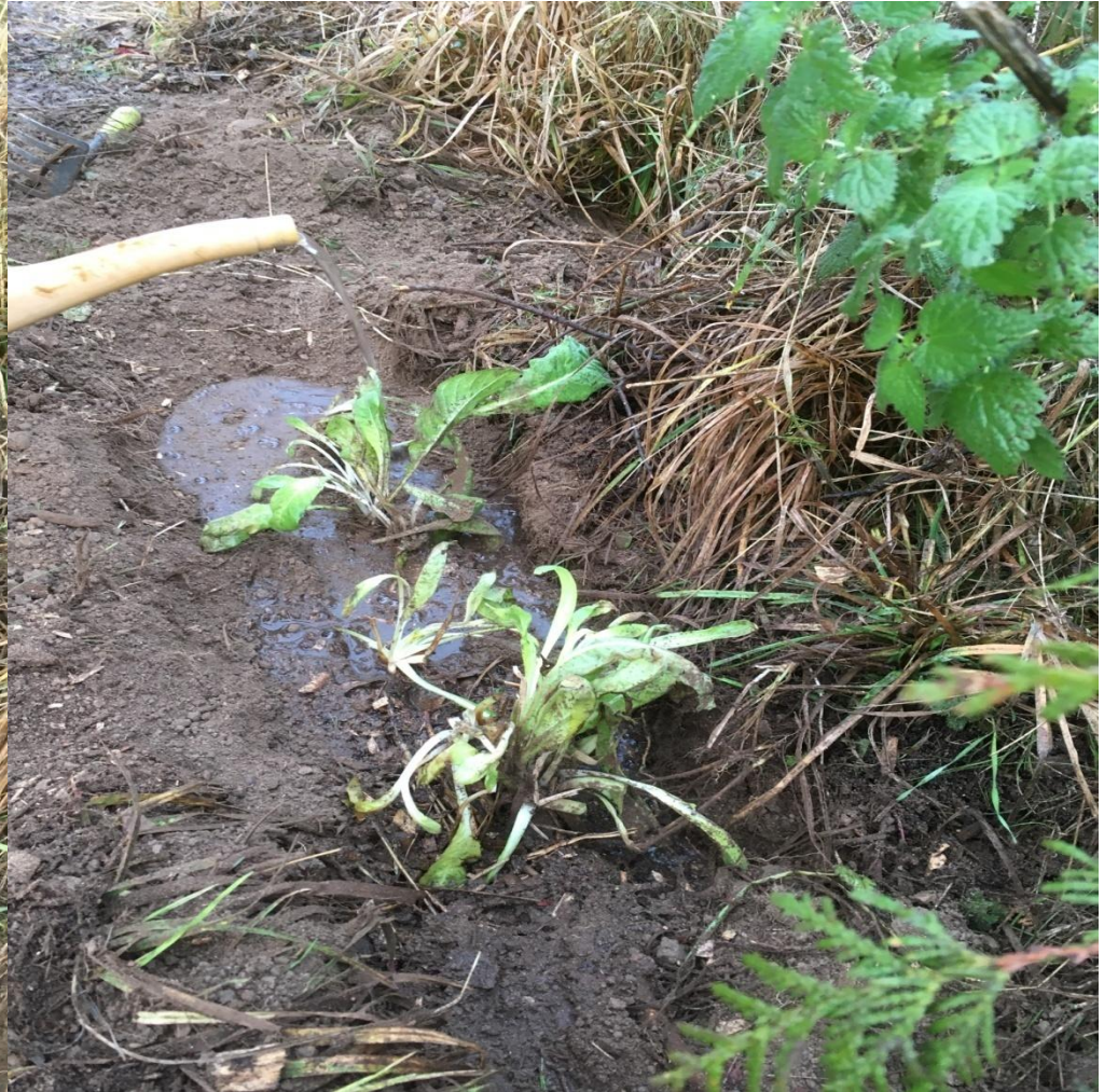
Nach dem Pflanzen...gut wässern!