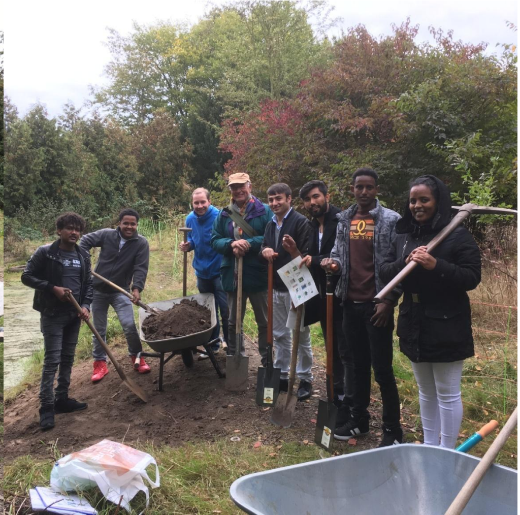
Gruppenbild am Kescherteich